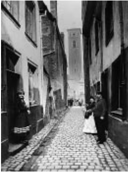
Bordell in der Holzstraße im Kölner Hafenviertel, um 1906, Köln