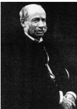
Henri Vieuxtemps (1820–1881)