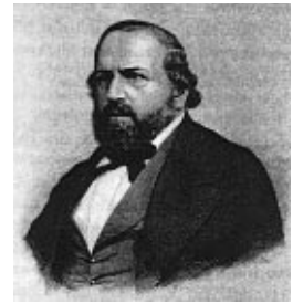
Ferdinand Hiller (1811–1885), 1872, Holzstich

So, nun habe ich mich darüber ausgesprochen, ob ich gleich weiß, daß es Euch keine Freude machen wird. Mir auch nicht. Warum kann ich das nicht alles mit dem Vormund abmachen, es verdirbt meine schönen Briefe. Uebrigens bitte ich Dich nochmals, mich nicht durch Nichterfüllung meines Wunsches in unglückliche Um-