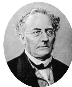
Friedrich Wilhelm Ritschl (1806-1876)