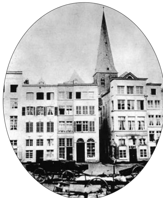
Köln, Heumarkt, um 1860