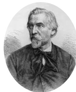
Anton Heinrich Springer (1825-1891), 1891, Holzschnitt nach einer Photographie