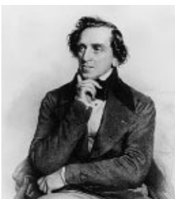
Josef Kriehuber; Giacomo Meyerbeer (1791–1864), 1847, Lithographie, München, Theatermuseum