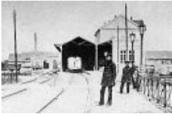
Bonn, Bahnhof der Köln-Bonner Eisenbahn, um 1870