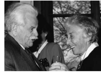
Mit dem Schriftsteller und Präsidenten der Tschechoslowakei Václav Havel im Schauspielhaus Zürich, 1990

Ist das nicht, denke ich, Elias Canetti, der da im Sitz des Intercity nebenan Platz genommen hat, und das Mädchen, das mit schweizerdeutschem Akzent mit ihm hochdeutsch spricht, muß seine Tochter sein, von der ich eben erst noch gehört zu haben glaube, daß sie zur Welt gekommen ist. (...) Ich sehe den Fünfundachtzigjährigen an, wie er sich über den Mittelgang des Abteils immer mehr zu mir wendet und über die Geschichte spricht, wie er sie jetzt wahrnimmt und daran lernen will und wie er die Leidenschaft des Denkens noch in keiner Weise eingetauscht hat gegen irgendeinen Altersstarrsinn oder eine sanfte Resignation. Franz Hohler, 1995