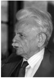
Zürich, Mai 1989