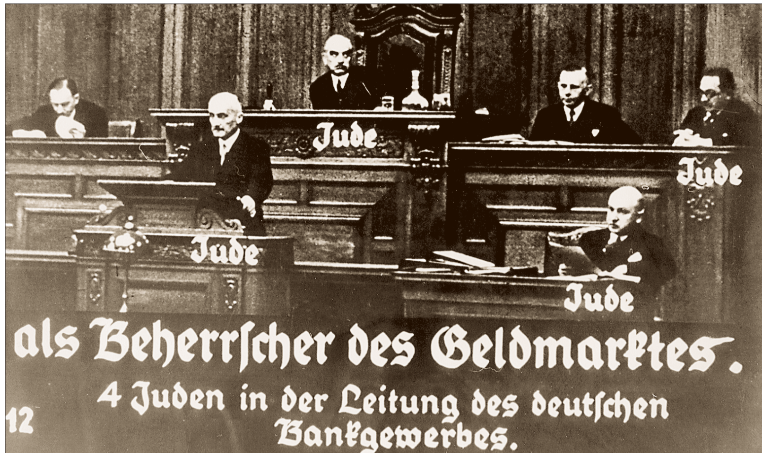
Zur „Schulung“ der Hitlerjugend diente dieses aufbereitete Hetzfoto der Tagung des Centralverbandes des Deutschen Bank- und Bankiergewerbes von 1931

Zwei Neuerscheinungen setzen sich kritisch mit der Rolle der Banken und der Bankiers während des nationalsozialistischen Regimes auseinander. Die Ergebnisse sind nicht erfreulich