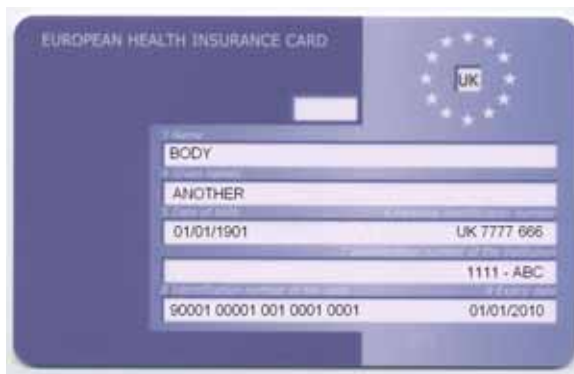
Abbildung 2.7: Die europäische Krankenversichertenkarte (EHIC) ist auf der Rückseite einiger nationalen Gesundheitsausweise angebracht.