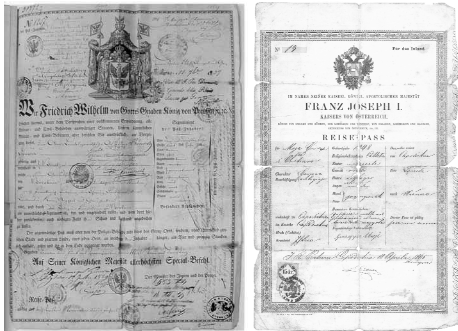
Abbildung 2.2: Preussischer (links) und österreichischer (rechts) Reisepass aus dem 19. Jahrhundert

Verfügung. Der Geleitbrief war also weniger ein Identitätsnachweis, sondern vor allem ein Dokument, das eine Berechtigung bescheinigte.