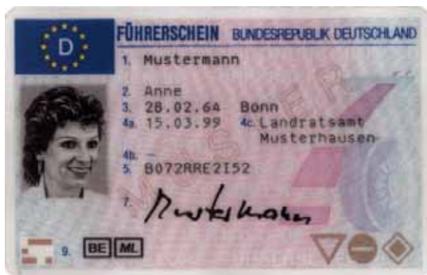
Abbildung 2.8: Der EU-Führerschein soll in den nächsten Jahren die nationalen Modelle der Mitgliedsstaaten ablösen.

Neben dem Führerschein gibt es noch zahlreiche weitere, von Behörden ausgestellte Ausweisdokumente. Man denke beispielsweise an Jagdscheine, Pilotenscheine, Angelscheine