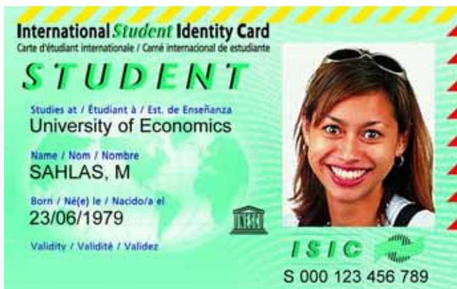
Abbildung 2.9: Die International Student Identity Card (ISIC) wird weltweit anerkannt.

Neben den Ausweisen, die jede Lehranstalt eigenständig ausgibt, gibt es auch einen international einheitlichen Studentenausweis: die International Student Identity Card (ISIC). Diese wird seit 1968 von der ISIC Association ausgegeben. Die ISIC Association gehört zur International Student Travel Confederation (ISTC), die sich als nichtkommerzielle Organisation den Belangen des studentischen Reisens widmet. Hinter dieser Vereinigung stehen etwa 70 Reiseanbieter, die an der Vermarktung von Studentenreisen interessiert sind.