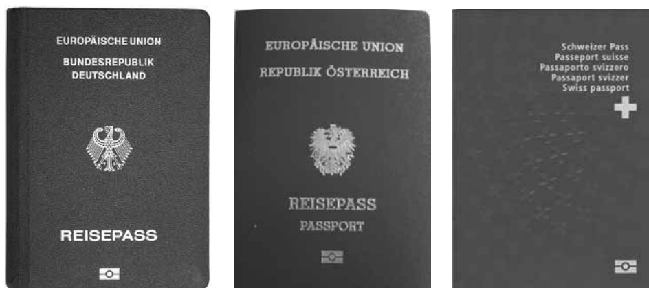
Abbildung 2.3: Reisepässe (hier jeweils ein Exemplar aus Deutschland, Österreich und der Schweiz) sind international standardisiert.

1920 legte der Völkerbund (Vorläufer der UNO) erstmals Richtlinien für Reisepässe fest, die zu einer internationalen Vereinheitlichung führen sollten. Allerdings hatte diese Maßnahme bei weitem nicht den gewünschten Erfolg. Nach Gründung der UNO im Jahr 1945 übernahm diese auch die Zuständigkeit für Reisepässe. Um deren Standardisierung kümmert sich seitdem die UNO-Tochterorganisation ICAO (International Civil Aviation Organization), die für Fragen der Luftfahrt verantwortlich ist. Dies ist kein Zufall, denn die Luftfahrtindustrie ist seit Jahrzehnten die treibende Kraft hinter der Weiterentwicklung und Standardisierung von Reisepässen. Fluggesellschaften müssen eine große Menge an Reisepassvorgängen durchführen und haben daher ein existenzielles Interesse daran, dass dies reibungslos funktioniert. Da die UNO 189 Mitgliedsstaaten hat, kommen den ICAO-Richtlinien eine große Bedeutung zu.