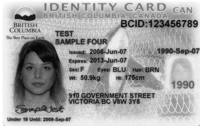
Abbildung 2.6: Die Identity Card des kanadischen Bundesstaats British Columbia ist ein Beispiel für einen Identitätsausweis.

In manchen Ländern ist der Bürger (meist ab einem bestimmten Alter) dazu verpflichtet, einen Identitätsausweis zu besitzen (Ausweispflicht). In anderen Ländern ist die entsprechende Pflicht auch mit dem Besitz eines Reisepasses erfüllt (dies ist etwa in Deutschland der Fall). Manche Staaten mit Ausweispflicht verlangen, dass der Bürger den Ausweis ständig bei sich trägt, wenn er seine Wohnung verlässt. In Ländern ohne Identitätsausweise verwenden die Bürger meist den Führerschein, den Reisepass oder teilweise sogar die Geburtsurkunde, um sich auszuweisen. Die Bürger von Staaten mit Identitätsausweisen aber ohne Ausweispflicht haben entsprechend die Wahl. Einige Staaten geben Identitätsausweise nur an ihre Staatsbürger aus, in anderen können oder müssen auch ausländische Personen, die sich dauerhaft dort aufhalten (Residenten), ein solches (oder ähnliches) Dokument besitzen.