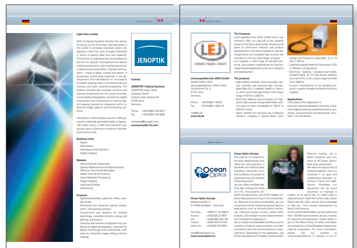
Layoutbeispiel für 1/1 bzw. 1/2 Seite