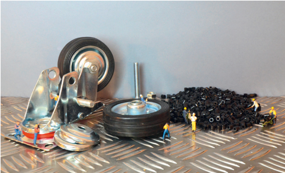
Bild 3.1 Die Qualitätssicherung ist eines der wichtigsten Instrumente im Produktentstehungsprozess.