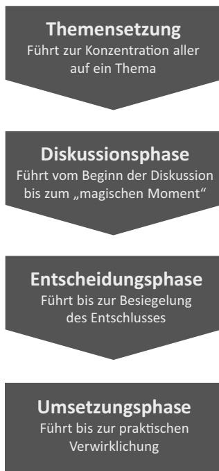
Bild 1.1 Das Prozessmodell