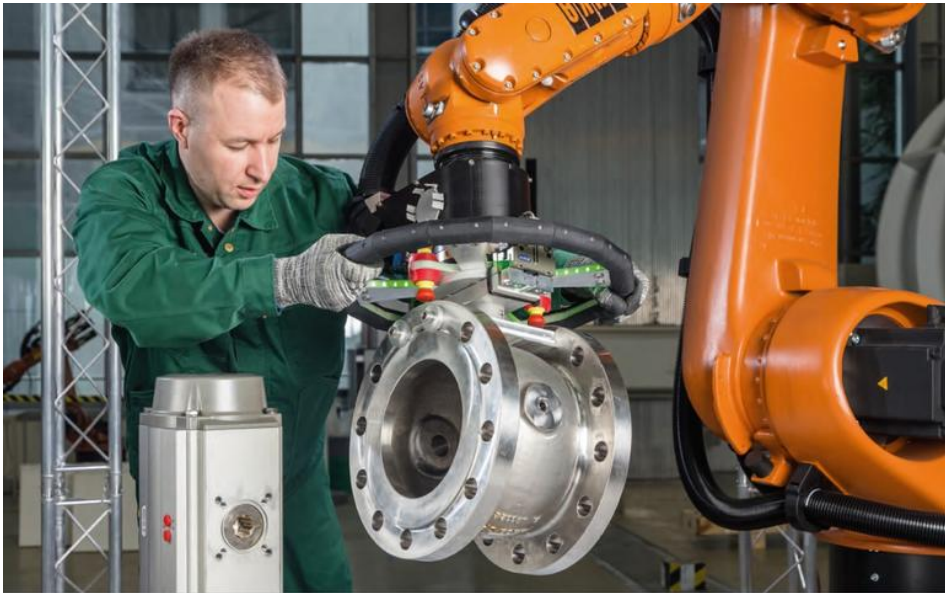
Abbildung 1.1 Handführung im Bereich Montage von Schwerlasten

nicht bewegen). Der Zustimmungstaster ist hierbei eine zwingend geforderte Sicherheitsfunktion. Weitere Informationen zum Thema Handführung finden Sie im Kapitel 7 .