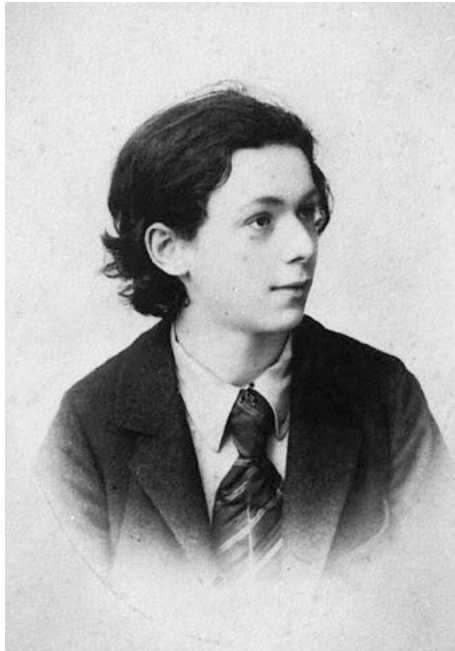
Otto Neurath im Alter von ungefähr zehn Jahren