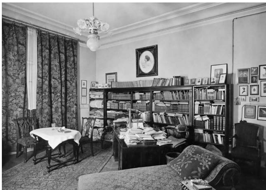
Das Wohn- und Arbeitszimmer, Lothringerstraße, Wien, aufgenommen nach dem Tod von Kraus.

obersten Reihe ein Viertel des Bretts noch mit Bildern verstellt ist. Er war kein Bibliophiler und kein Bibliomane. Er ließ sich Bücher aus Bibliotheken besorgen, wenn er sie brauchte, oder lieh sie sich bei Freunden aus. Bekam er Bücher zugeschickt, die ihm nicht wichtig wurden, verschenkte er sie oder ließ sie zum Antiquar bringen. Die vorhandenen Bücher sind teils schöne und kostbar wirkende Ausgaben der Klassiker: Goethe, Schiller, Shakespeare und Jean Paul. Dann aber auch Widmungsexemplare (wie belegt ist) von Frank Wedekind, Gerhart Hauptmann, Detlev von Liliencron und anderen wenigen Zeitgenossen, die er schätzte. Auf der anderen Längsseite neben einer Art Kommode mit matten Glasfenstern, einem »Kasten«, wie das damals hieß, steht noch ein kleines offenes Regal, in dem sich ebenfalls Arbeitsmaterialien stapeln.