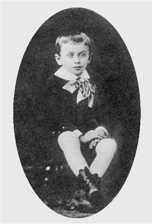
Karl Kraus, zirka 1878.

machen suchte. Als cholerisch und aufbrausend wird er in den wenigen erhaltenen Andeutungen geschildert.