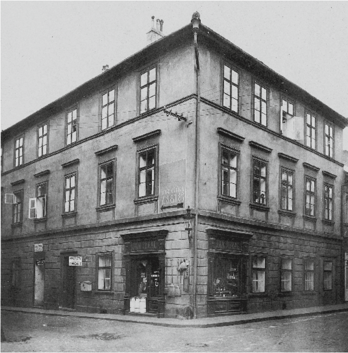
Das Geburtshaus in Jičín, Altstadt, Stare mesto, Haus Nr. 43/44.

Mund. Es war also eine Hinaufheirat für einen aufstrebenden Handelsmann, wenn er die Arztochter heiratete. Seine eigene Karriere wird die Erwartungen der Schwiegereltern aufs Schönste bestätigt haben.